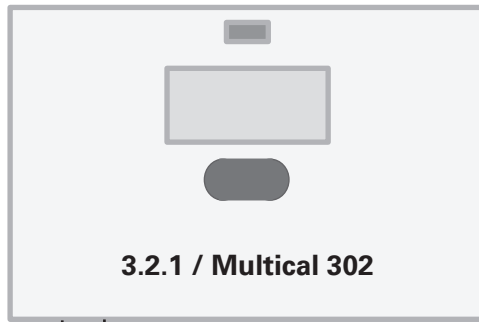
3.2.1 / Multical 302